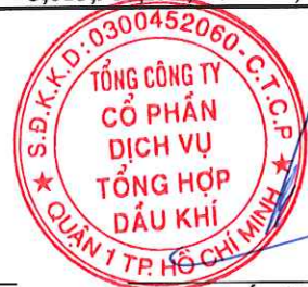
Phùng Tuấn Hà Chủ tịch HĐQT

Các thuyết minh từ trang 6 đến trang 21 là một bộ phận một hợp thành của báo cáo tài chính hợp nhất